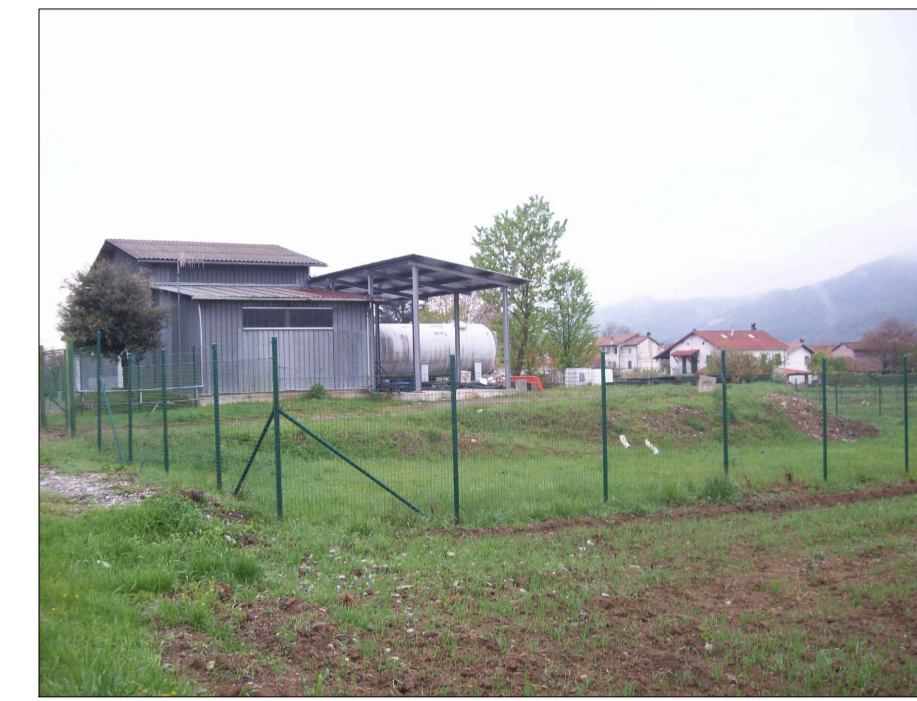
Impianto di filtrazione stato attuale