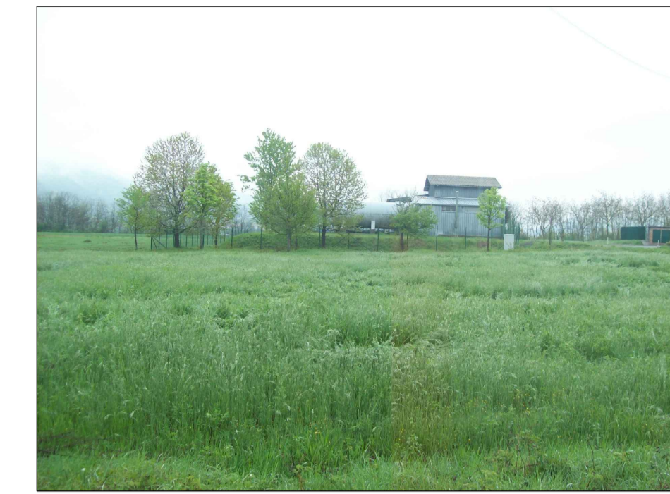
Area dove si prevede la costruzione del nuovo impianto a fianco dell'edificio esistente